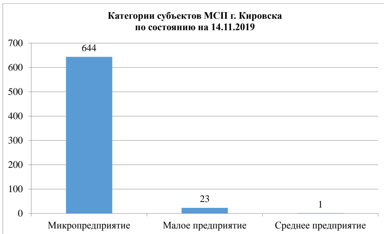
График № 2

Сектор малого предпринимательства сосредоточен в основном в сферах торговли и предоставления услуг населению. Среднее предприятие (ООО «Техносервис горных машин и оборудования») представлено в сфере с более высокой добавленной стоимостью - в обрабатывающей промышленности.