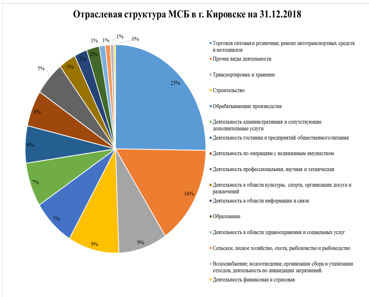
График № 3

Отраслевая структура малого и среднего предпринимательства г. Кировска по состоянию на 31.12.2018 представлена на графике № 3 и таблице № 1: